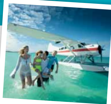
水上飛機的尊貴體驗